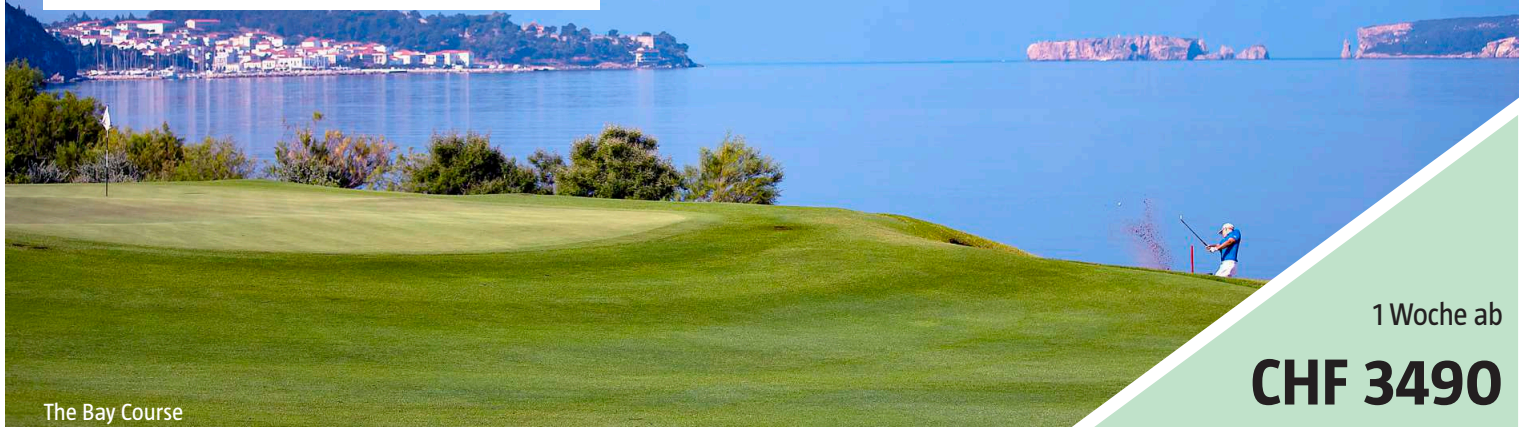
The Bay Course