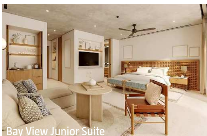
Bay View Junior Suite

Sport/Wellness: Spa mit grosser Auswahl an Behandlungen, Hallenbad, Sauna, Hammam, Fitnessstudio, Wassersport.